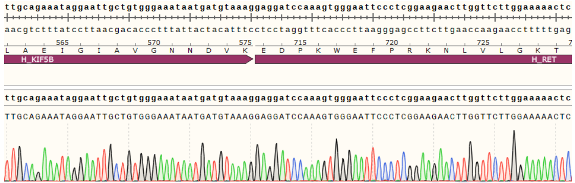
Fig 2. H_KIF5B-RET BaF3 Cell Line 测序结果